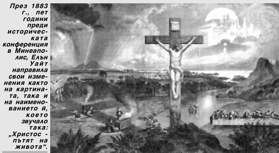
През 1883 г., пет години преди историческата конференция в Минеаполис, Елън Уайт направила свои изменения както на картината, така и на наименованието ѝ, което звучало така: „Христос - пътят на живота“.